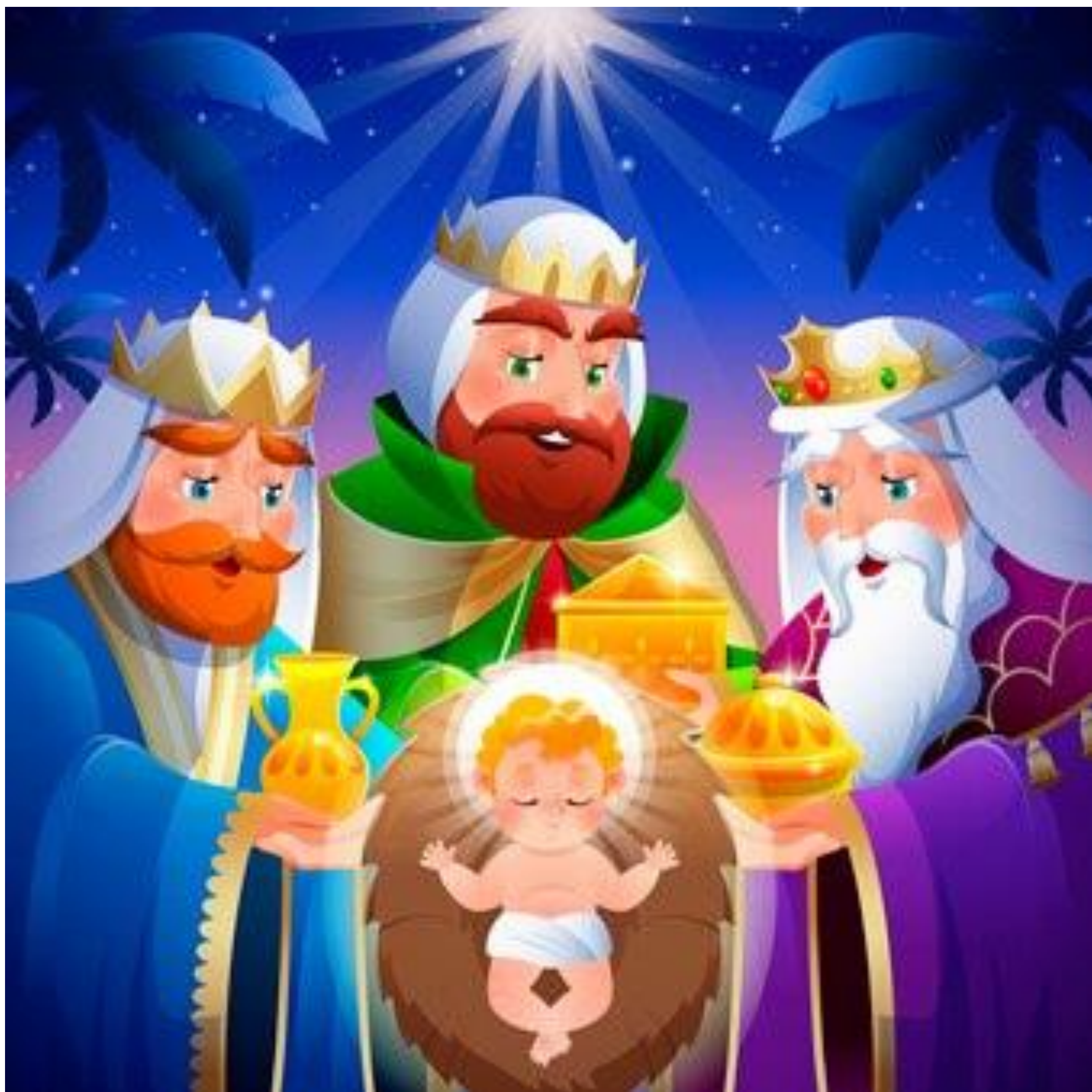
Le Chemin Tracé