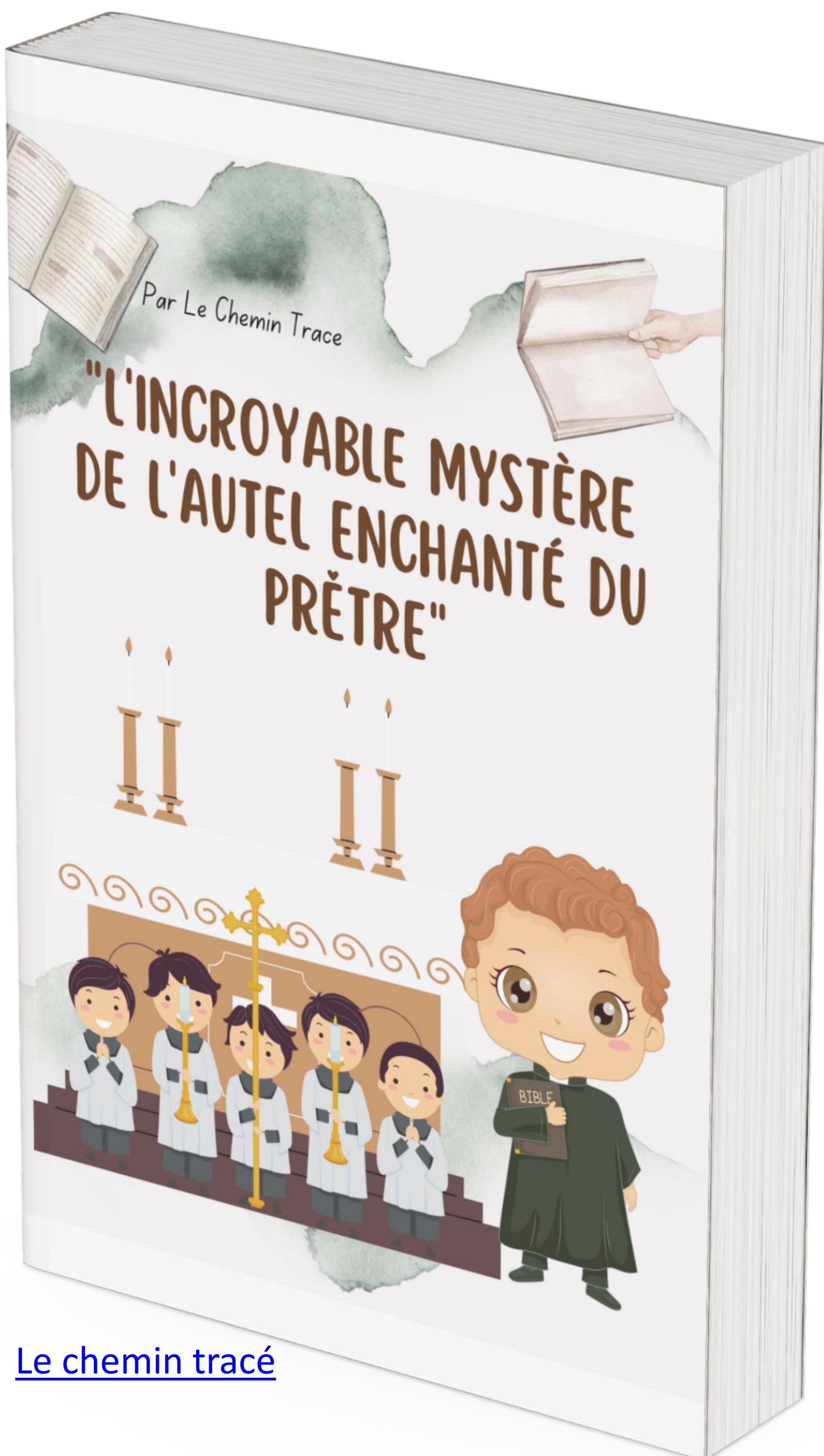
Le chemin tracé